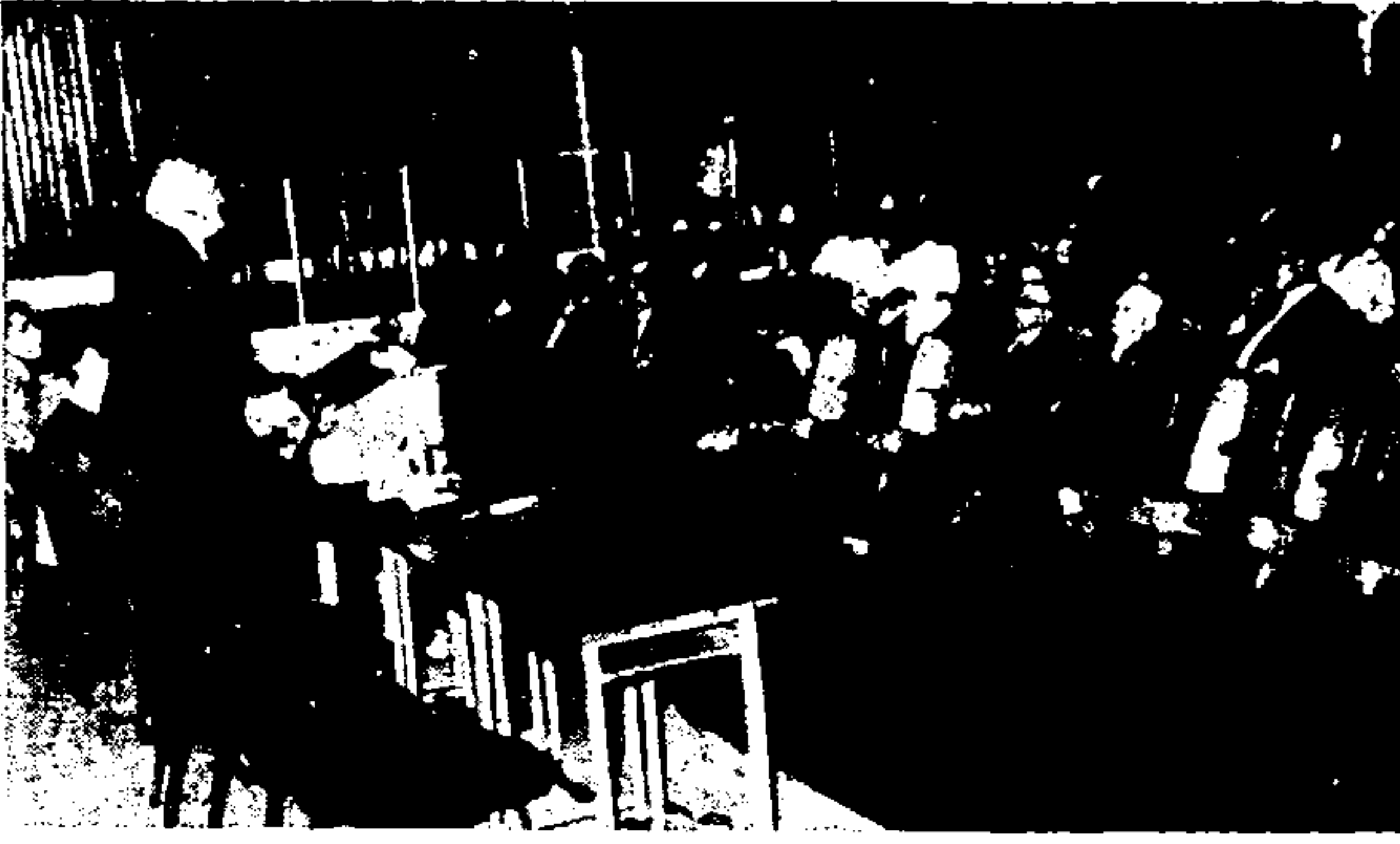
Αιτεί τις μέρες γίνεται στην Αθήνα ένα συνέδριο της Διεθνούς Έταιρας Λογοτεχνικών Κριτικών...